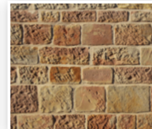
Les bâtiments en maçonnerie de grès et de calcaire dur (enduite ou non enduite)