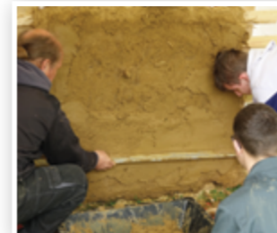
Les bâtiments en torchis

C'est aussi aux matériaux de construction utilisés que l'on peut reconnaître l'architecture boulonnaise.