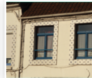
Les décors en faïence de Desvres