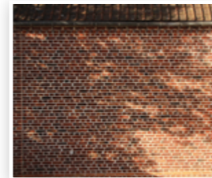
Les bâtiments en maçonnerie de briques (enduite ou non enduite)