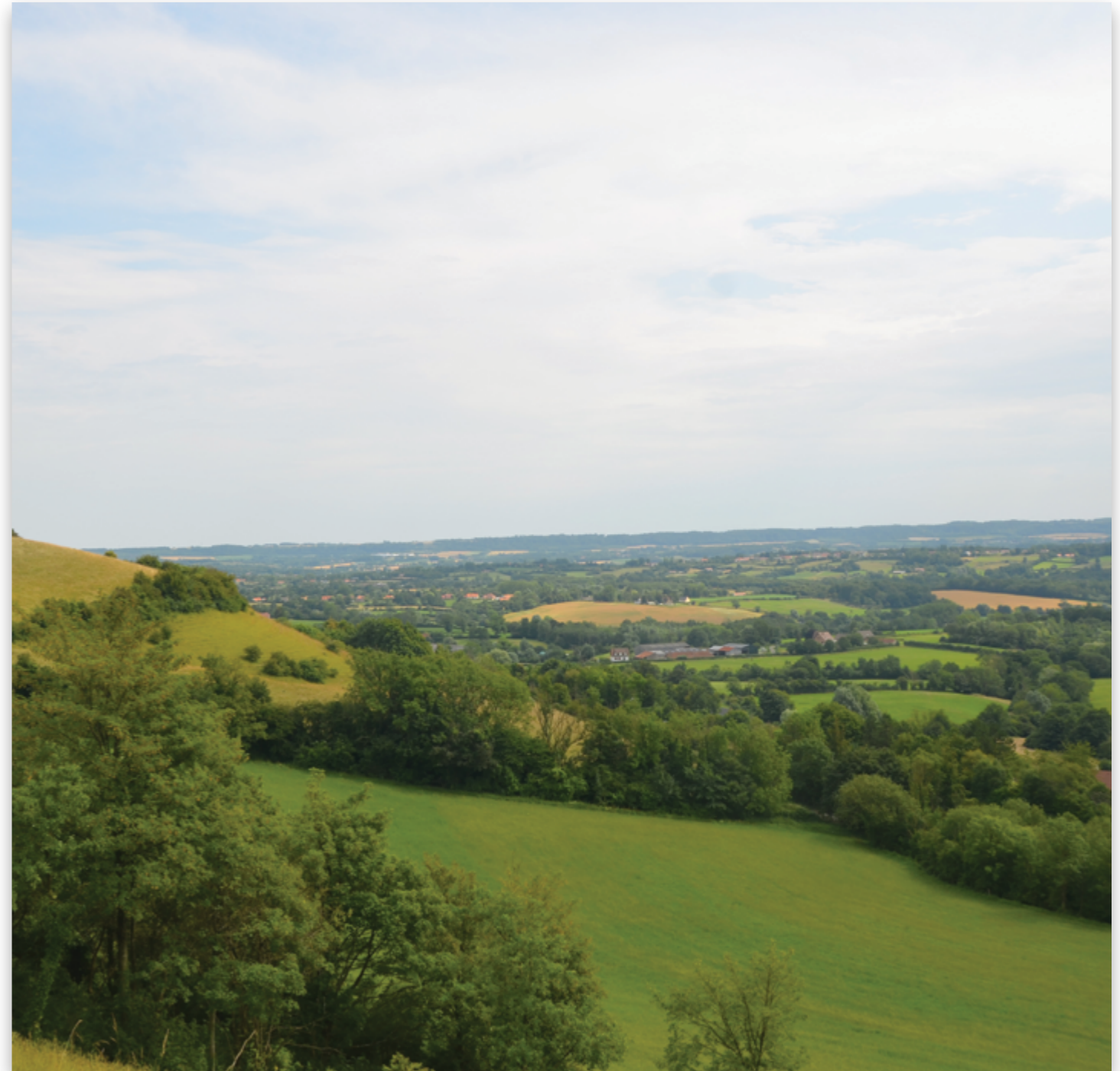
Vue sur le bocage boulonnais depuis la cuesta, en surplomb de Nabringhen.

faune et une flore riches et fragiles. C'est un territoire habité où les hommes ont érigé des fermes et des longères à l'architecture typique. C'est le lieu d'expression d'une culture locale encore bien vivante aujourd'hui. Plus qu'un paysage, le bocage boulonnais est un art de vivre qui doit être aimé et préservé. Vous êtes curieux et en quête d'authenticité ? Partez ou repartez à la découverte de ce territoire attachant qu'est le bocage boulonnais.